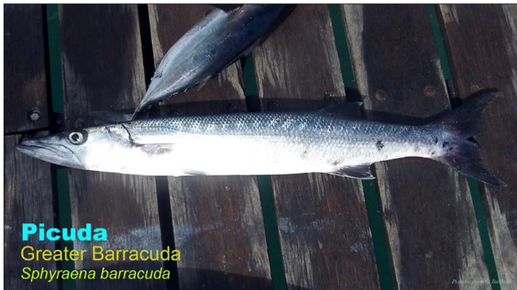
Picuda Greater Barracuda Sphyraena barracuda